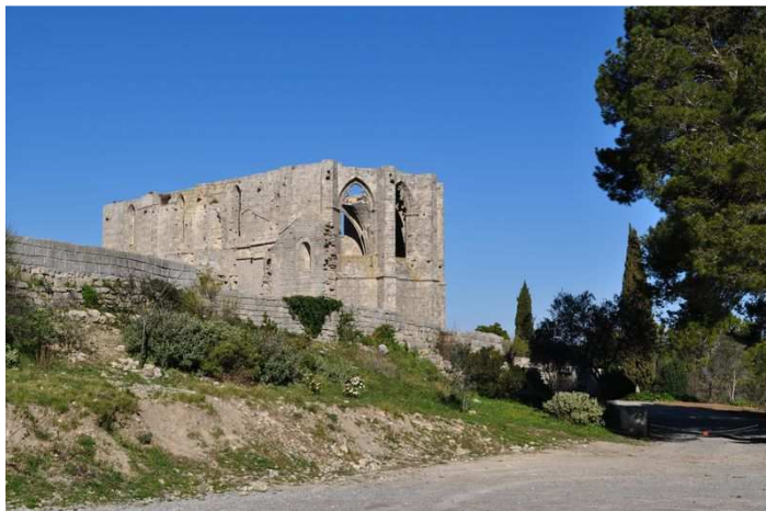
Abbaye de St Félix de Monceau

À 30 km du Crès, une promenade sportive nous permettra de découvrir un massif près de Montpellier : « Le Massif de la Gardiole » qui au printemps se couvre de fleurs de Cistes et de genets, les vestiges d'une église gothique et ceux d'une chapelle romane du 12 ème qui appartenaient à l'Abbaye St Félix de Monceau. Un des plus beaux points de vue de la région.